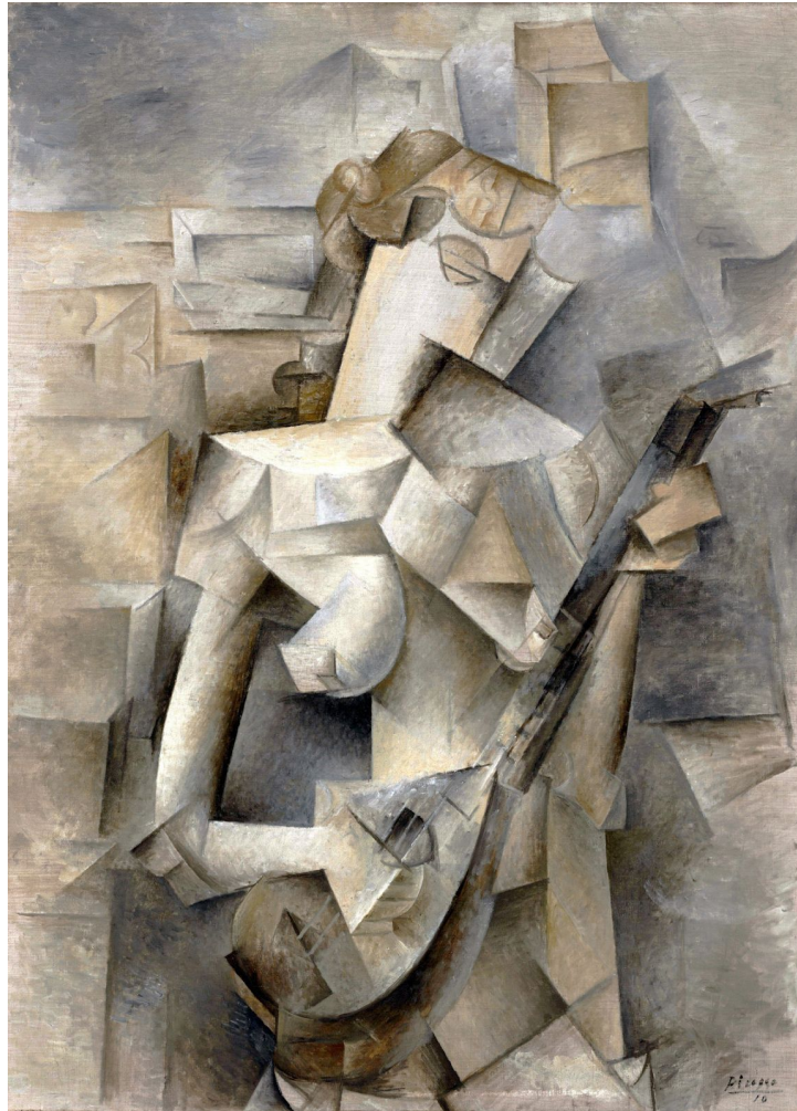
Pablo Picasso - Fille à la Mandoline , 1910

Aigüisez encore votre regard des contrastes et observez attentivement dans ce tableau, les différents points évoqués jusqu'à maintenant. Notez vos observations ci-dessous.