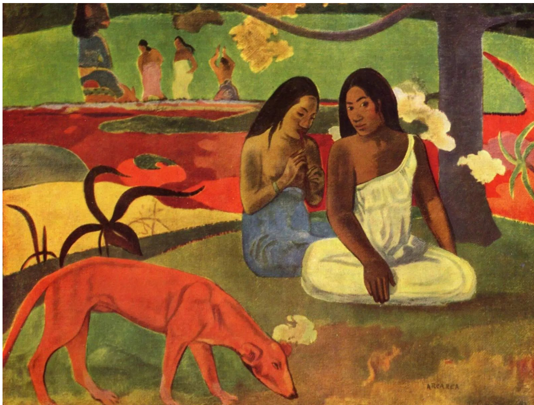
Paul Gauguin - Arearea (joyeusetés) , 1892.

Regardez ce tableau et observez comment l'organisation des contrastes guide votre regard dans les 4 secteurs du tableau (en haut à gauche, en haut à droite, en bas à gauche et en bas à droite). En terme de hiérarchie des contrastes, où êtes-vous appelé(e) en premier lieu dans ce tableau. Notez vos observations ci-dessous.